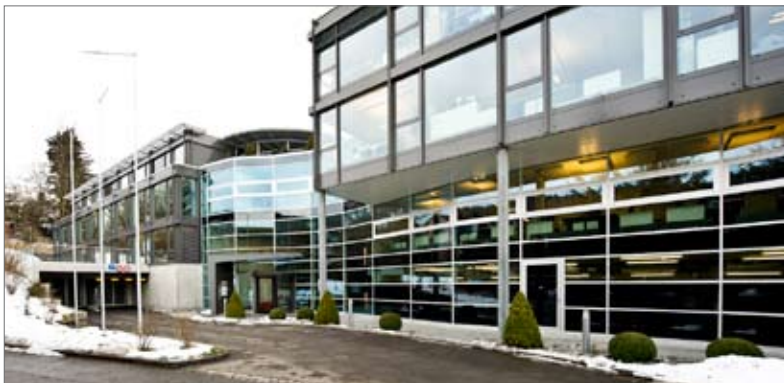
Mattenstrasse 8, Gümligen